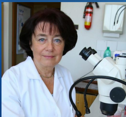
Eva Syková ředitelka Ústavu experimentální medicíny Akademie věd ČR