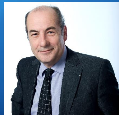
Michel Fleischmann prezident mediální skupiny Lagardère

Pořádáme mimo jiné například konferenci Hledání výjimečnosti, která se snaží poukázat na zajímavé inspirativní příběhy. Akci pořádáme ve spolupráci se Senátem Parlamentu České republiky.